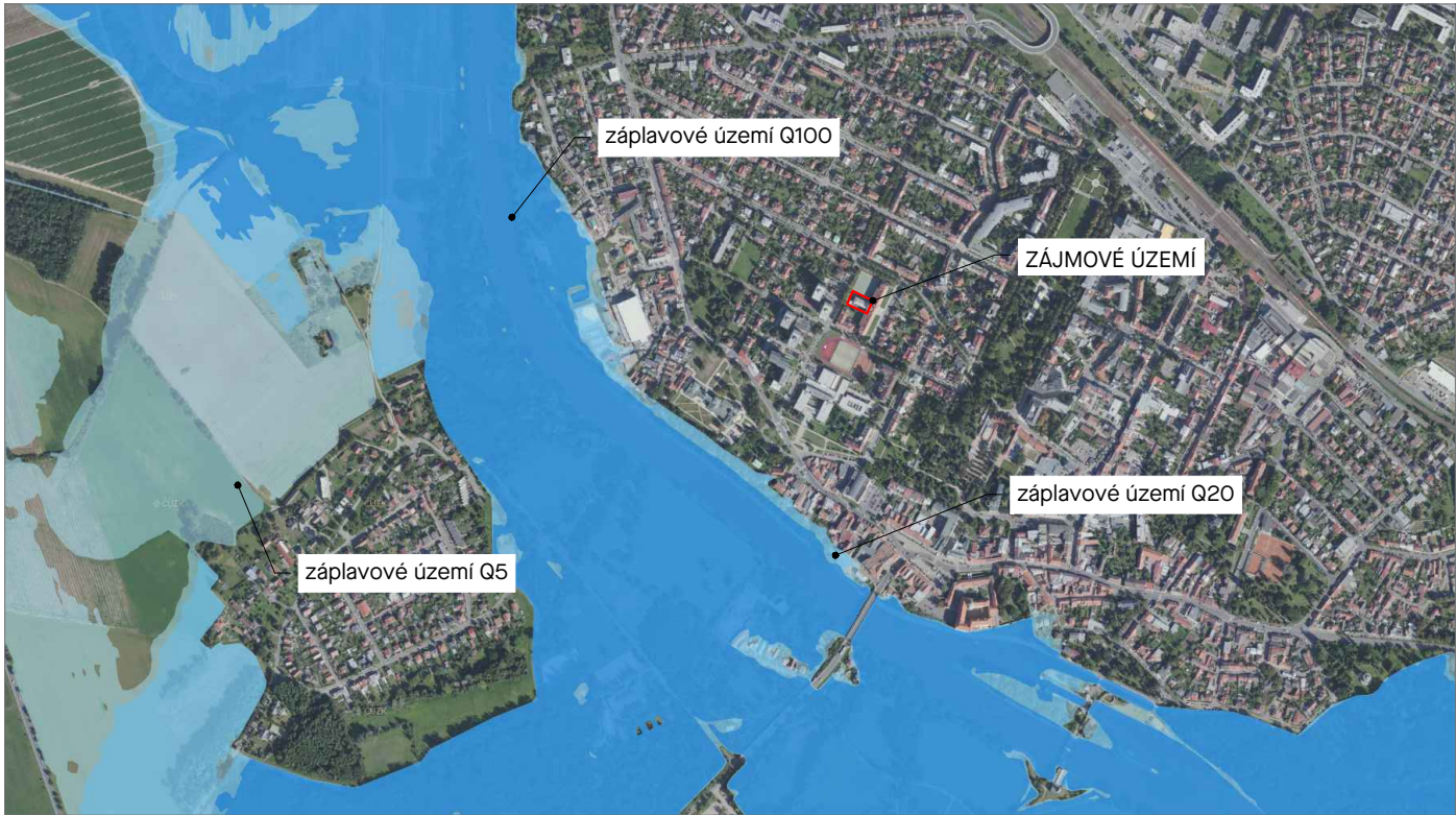
Řešené území ve vztahu k zájmům ochrany životního prostředí, záplavové území.