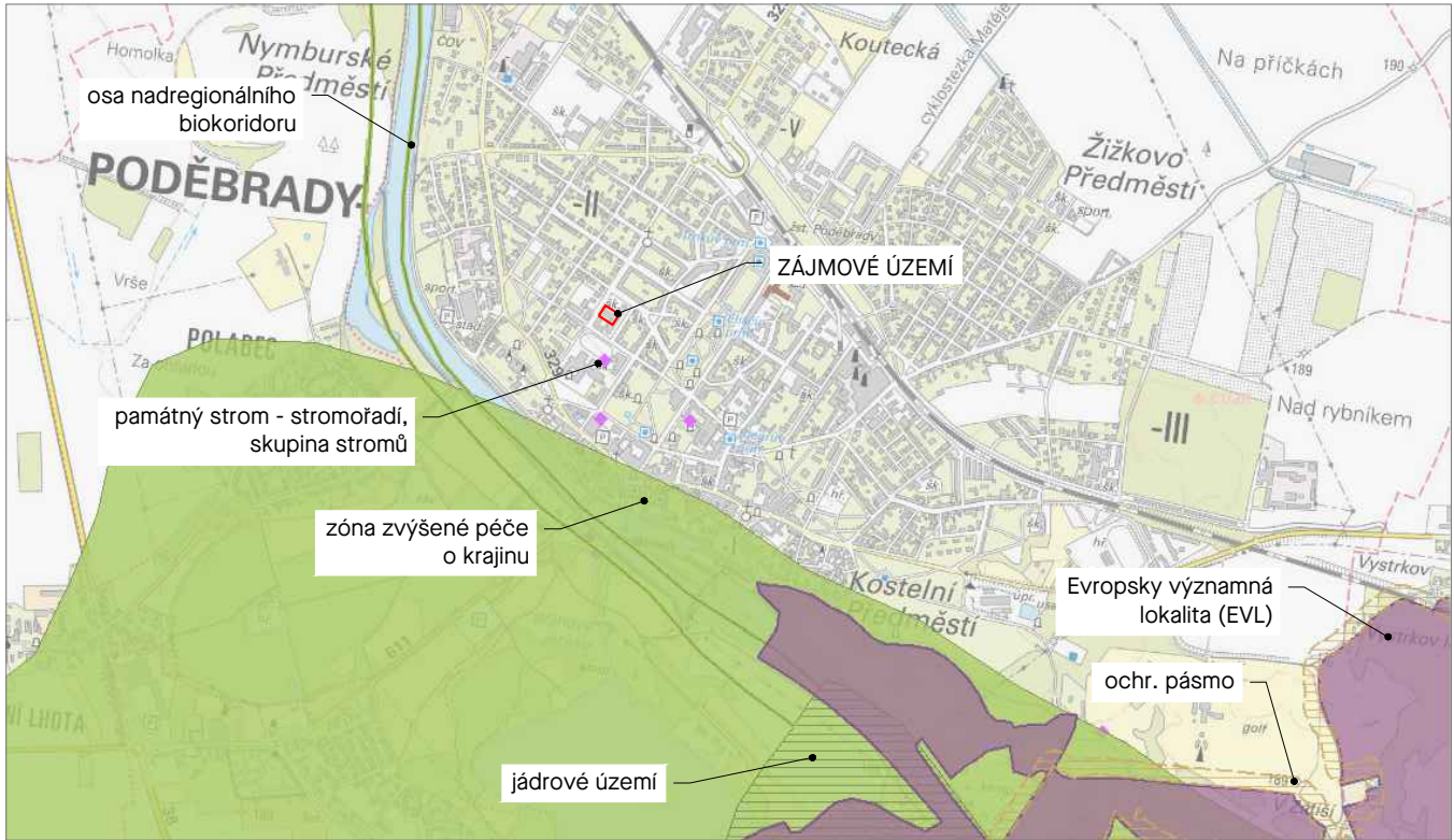
Řešené území ve vztahu k zájmům ochrany území.